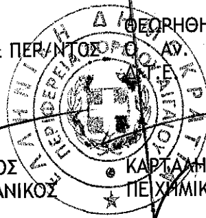
ΚΑΡΤΑΛΗΣ ΧΡΗΣΤΟΣ ΠΕΙΧΗΜΙΚΩΝ ΜΗΧΑΝΙΚΩΝ